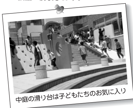
中庭の滑り台は子どもたちのお気に入り

思い起こせば、30数年前の私もそんな日々を過ごしていました。仲間と遊び、そして学ぶ。それが全ての、でも楽しい毎日でした。