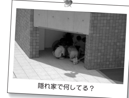
隠れ家で何してる？