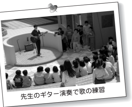
先生のギター演奏で歌の練習