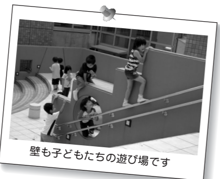
壁も子どもたちの遊び場です