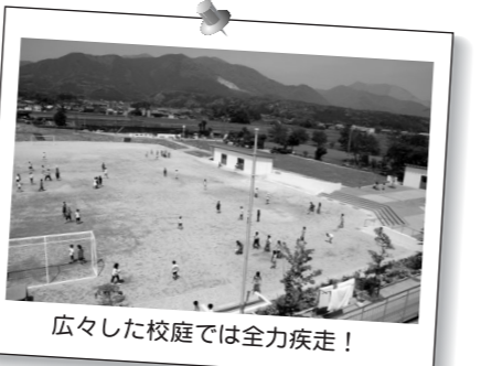
広々した校庭では全力疾走！