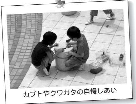
カブトやクワガタの自慢しあい